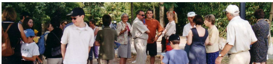
Les participants avant le départ